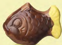
Praliné et noix de coco caramélisée