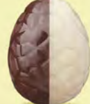
Praliné avec éclats de noisettes